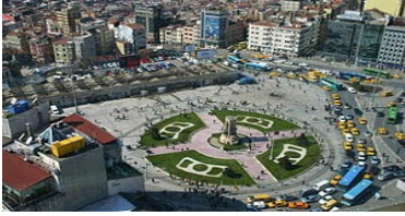
2015 1 Mayıs'ının Ardından Bende Kalanlar