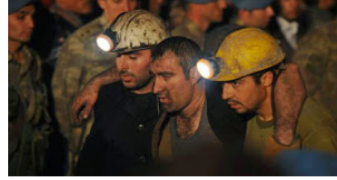
Günler Soma'yı Getirirken