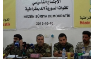
Demokratik Suriye Güçleri'nin ilk hedefi Rakka'yı IŐİD'den