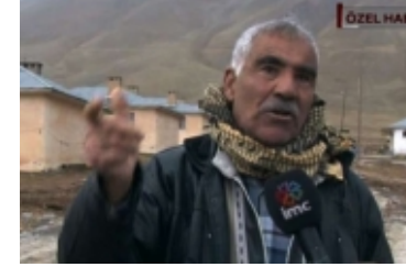
HDP'ye oy veren köylüler karakola çağrılıyor