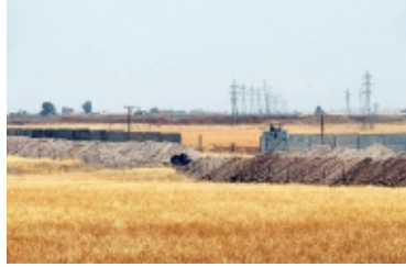
Rusya: Reyhanlı sınırından her gece 100 militan