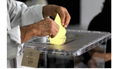
YSK'ya rađmen sandık taşıma kararı!