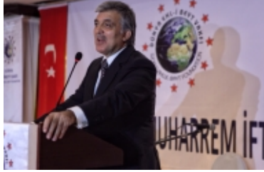
Gül, Demirtaő'a dilediđi başsađlıđına yönelik